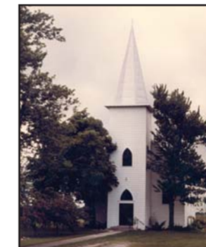
Credit: Buxton National Historic Site and Museum Buxton Settlement. Lieu historique national de Buxton.