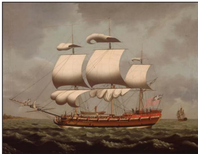
A slave ship out of the British port of Liverpool around 1780. Un vaisseau transportant des esclaves à la sortie du port anglais de Liverpool autour de 1780.

In the 18 th century, Black Canadians began a long journey, one composed of many human stories. These narratives encompass groundbreaking laws, acts of personal heroism, as well as years of steady and determined work. "On the Road North" tells just some of these stirring tales of idealism, courage and leadership.