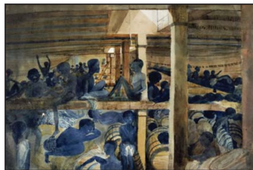
The interior of the Albion, its decks crowded with slaves, was captured in 1845.