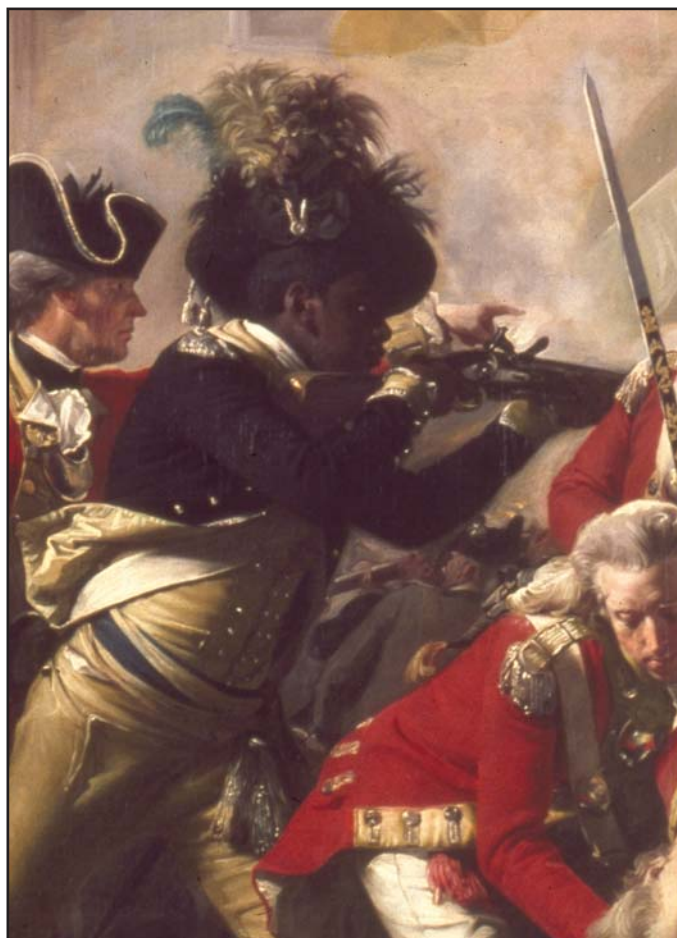
Credit: National Archives, UK Mention de source : The Death of Major Pitcairn, par John Singleton Copley, Tate Gallery, Art Resource

When the revolution erupted in the American colonies in 1775, Britain offered freedom to slaves who fought for the British in North America. The Americans won the war in 1783, and Black Loyalists joined the flood of refugees moving north. Though they founded one of the first free Black communities in Canada, they also suffered great hardship.