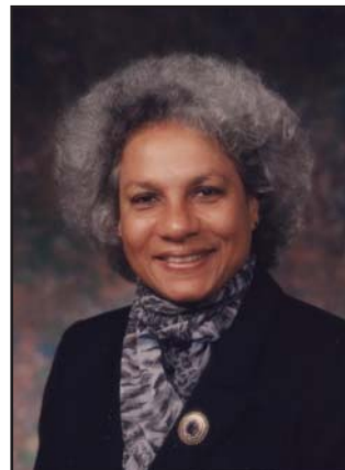
The Honourable Anne C. Cook, first Black Senator of Canada L'honorable Anne C. Cook, la première sénatrice noire du Canada