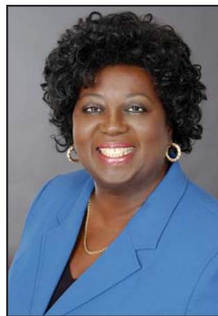
The Honourable Jean Augustine, P.C., Fairness Commissioner for the province of Ontario and the first Black woman elected to the House of Commons. In 1992, Ms Augustine introduced the motion in the House of Commons which led to the establishment of Black History Month. L'honorable Jean Augustine, C.P., commissaire à l'équité de la province de l'Ontario et première femme de race noire élue à la Chambre des communes. En 1992, Madame Augustine a présenté la motion à la Chambre des communes qui a abouti à la création du Mois de l'histoire des Noirs.

Courriel : information@pc.gc.ca www.pc.gc.ca/clmhc-hsmbc/