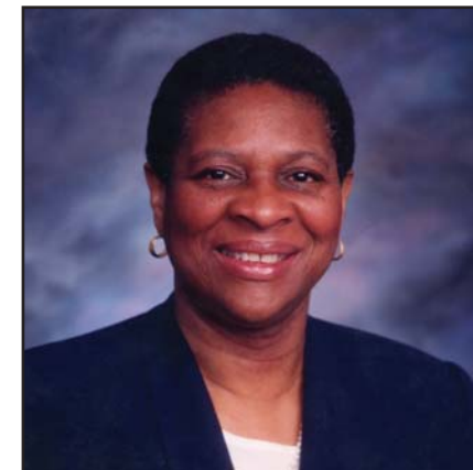
The Honourable Juanita Westmoreland-Travé, Judge, Court of Quebec, District of Montreal L'honorable Juanita Westmoreland-Travé, juge, Cour du Québec, district de Montréal