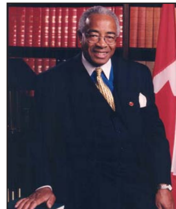
The Honourable Donald H. Oliver, Q.C., Senator of Canada L'honorable Donald H. Oliver, c.r., sénateur du Canada

Le voyage que les Canadiens de race noire ont entrepris au 18 e siècle, un périple jalonné par l'adoption de lois visionnaires, des sacrifices héroïques ainsi qu'un travail acharné et déterminé, n'est pas arrivé à terme. Permettez-nous de vous présenter quelques-unes parmi les nombreuses personnes qui sont aujourd'hui des chefs de file.