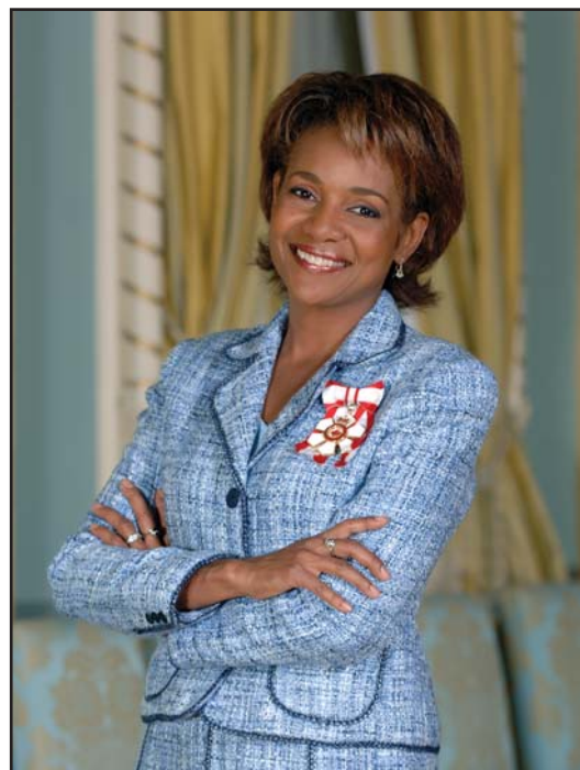
Her Excellency the Right Honourable Michaëlle Jean, C.C., C.M.M., C.O.M., C.D., Governor General and Commander-in-Chief of Canada Son Excellence la très honorable Michaëlle Jean, C.C., C.M.M., C.O.M., C.D., Gouverneure générale et Commandante en chef du Canada

The journey that Black Canadians began in the 18 th century – a journey punctuated by visionary new laws, heroic sacrifices and hard, determined work – is not over. Let us introduce you to a few of the many who are leaders today.