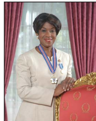
The Honourable Mayann E. Francis, O.N.S., Lieutenant-Governor of Nova Scotia L'honorable Mayann E. Francis, O.N.S., Lieutenant-gouverneure de la Nouvelle-Écosse

The journey that Black Canadians began in the 18 th century – a journey punctuated by visionary new laws, heroic sacrifices and hard, determined work – is not over. Let us introduce you to a few of the many who are leaders today.