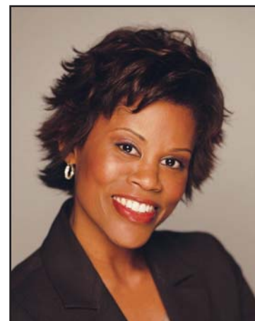
Marvi Ien, News Anchor for Canada AM Marvi Ien, chef d'antenne de l'émission Canada AM