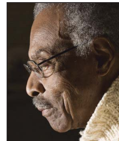
The Honourable Lincoln M. Alexander, former Lieutenant-Governor of Ontario, author of Go to School, You're a Little Black Boy , 2007 L'honorable Lincoln M. Alexander, ancien Lieutenant-gouverneur de l'Ontario, auteur de Go to School, You're a Little Black Boy , 2007

Crédit: British Library and Archives Canada, PA 17064 Musée de la guerre (ci-dessus à gauche) / Bibliothèque et Archives Canada, PA 17064